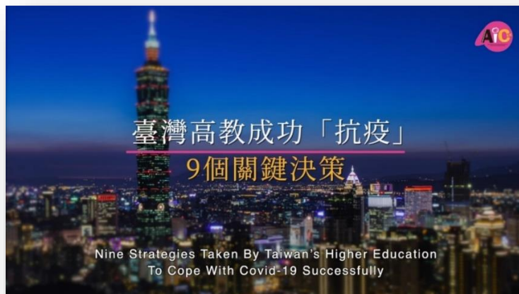
臺灣高教成功「抗疫」9大關鍵決策影片封面