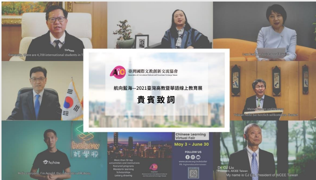
本次教育展突破傳統，特別邀集國內外產官學民意見領袖共同向國際發聲